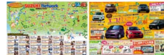
株式会社スズキ自販北海道 様 「60店舗合同キャンペーン エコいこフェア」