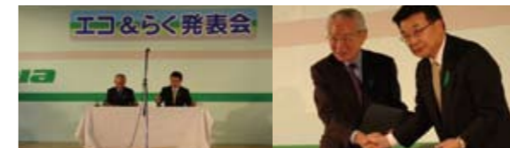
ブリヂストン・タイヤ・セールス・北日本株式会社 様 「エコピア販売キャンペーン エコ&らく発表会」