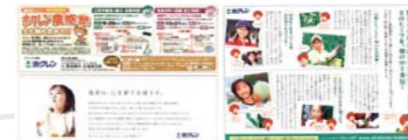
ホクレン農業協同組合連合会 様 「エコチル誌面 ホクレン“農”感塾」