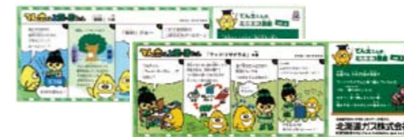
北海道ガス株式会社 様 「エコチル誌面 てん太くんとエコちゃん」