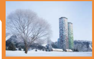
星野リゾート トマム